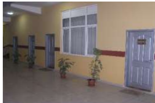
Borsamız Tescil ve Vezne Servisi, Yeni Tuvalet ile Toplantı Salonunun bulunduğu giriş kattan görünüm.