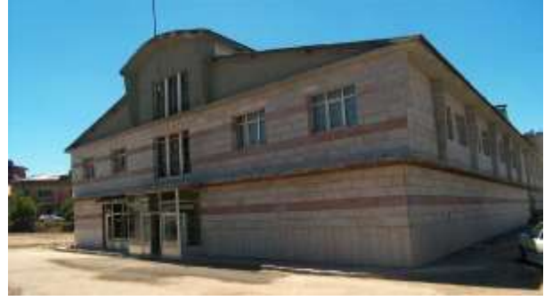
Borsamız Merkez Binası Yeni Hali

Zemin katta bulunan B/5 ve B/7 nolu dükkanlar tadilat yaptırılarak laboratuvar haline getirilmiş Gıda, Yem tahlil ve analiz makinaları son teknoloji cihazları ile donatılmıştır. Laboratuvar 1999 yılının başından itibaren faaliyete geçmiştir. Bölgemizin tek geniş kapsamlı laboratuvarına ilimiz üreticisi, sanayicisi, tüccarı ve ihracatçısı kavuşmuş olacaktır. Bölgemizde böyle bir laboratuvarın olması, en basit bir patates tahlili için, bölgemiz ihracatçıları batıya gidip analiz yaptırma durumundan kurtarılmıştır.