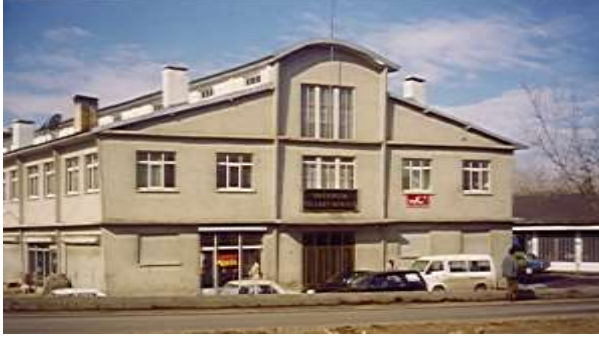
Borsamız Merkez Binası Eski Hali

Borsamız 1.000 m 2 üzerine yapılmış bir borsa binasına sahiptir. Giriş ve üst kat ile bodrum katı olmak üzere toplam 3 kattan müteşekkildir.