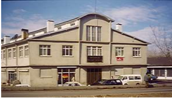
Borsamız Merkez Binası Eski Hali

Ayrıca 2007 Yılı içerisinde Borsamız Merkez Binası Dış Cephesi restore edilerek modern bir görünüm kazandırılmıştır.